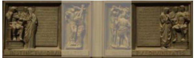
Detalo pri la Edikto de Milano

Ni vidu la du panelojn de la Edikto de Milano. Maldestre estas la portreto de Konstanteno kaj dekstre estas la portreto de Licinjo. Inter ili, du tabuloj montras la kernon de la Edikto.