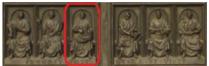
Bazo de la pordo kun la episkopo Castrilianus

Sed, ni rigardu detale la portreto de la Episkopo Castrilianus: