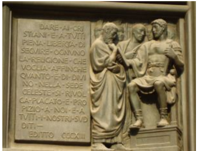
Dekstra tabulo kun Licinjo

De tiam, ĉesis la persekutoj kontraŭ la kristanoj en la Romia Imperio.