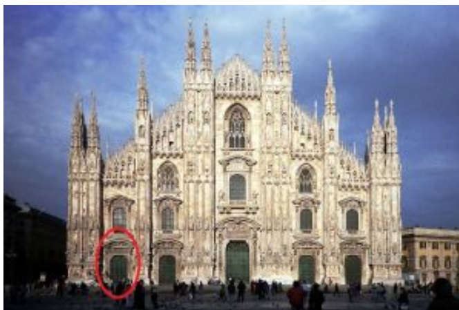
Katedralo de Milano

Por enkonduki la temojn de nia kunveno, mi startos de la Katedralo de Milano. Rigardante la Katedralo ni rimarkas sur ĝia fasado kvin bronzaĵajn pordojn. La unua pordo maldekstre estas nomata "Pordo de la Edikto de Milano", konata ankaŭ kiel "Edikto de Toleremo". Ni rigardu ĝin detale.