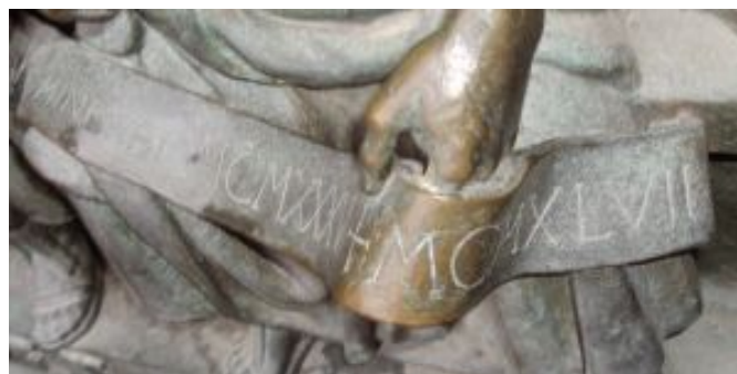
La du datoj: MCMXXXVI + MCMXLVII