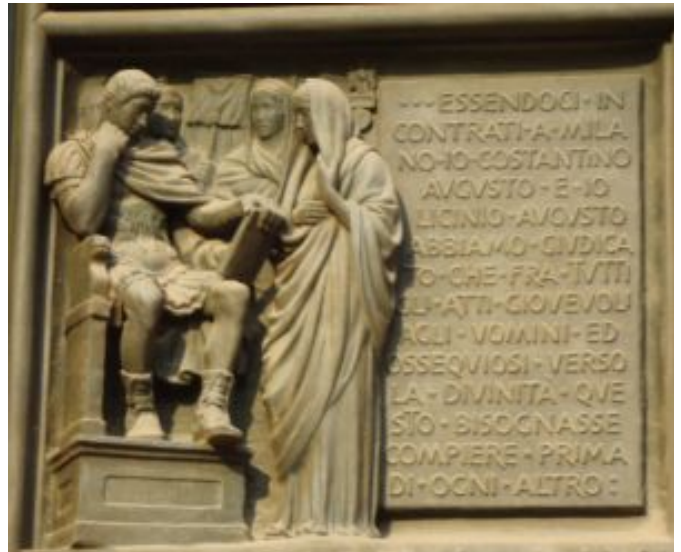
Maldekstra tabulo kun Konstanteno

Renkontiĝinte en Milano, mi Konstanteno Aŭgusto kaj mi Licinjo Aŭgusto juĝis, ke, inter ĉiuj faroj utilaj al la homoj kaj respektemaj al la diaĵo, antaŭ ĉio necesas plenumi ĉi tion: